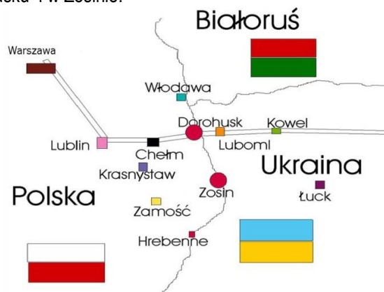
Rysunek 2. Przejścia graniczne w Dorohusku i w Zosinie.